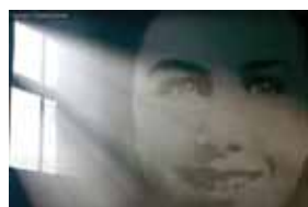
Paulette Duhalde (court métrage de 8' réalisé en coopération (AASSDN ASAF; 2023)