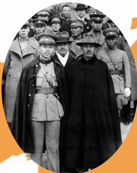
Zhang Xueliang avec Chiang Kai-shek quelques années avant l'incident de Xi'an

ou l'art chinois de transformer les crises en opportunités