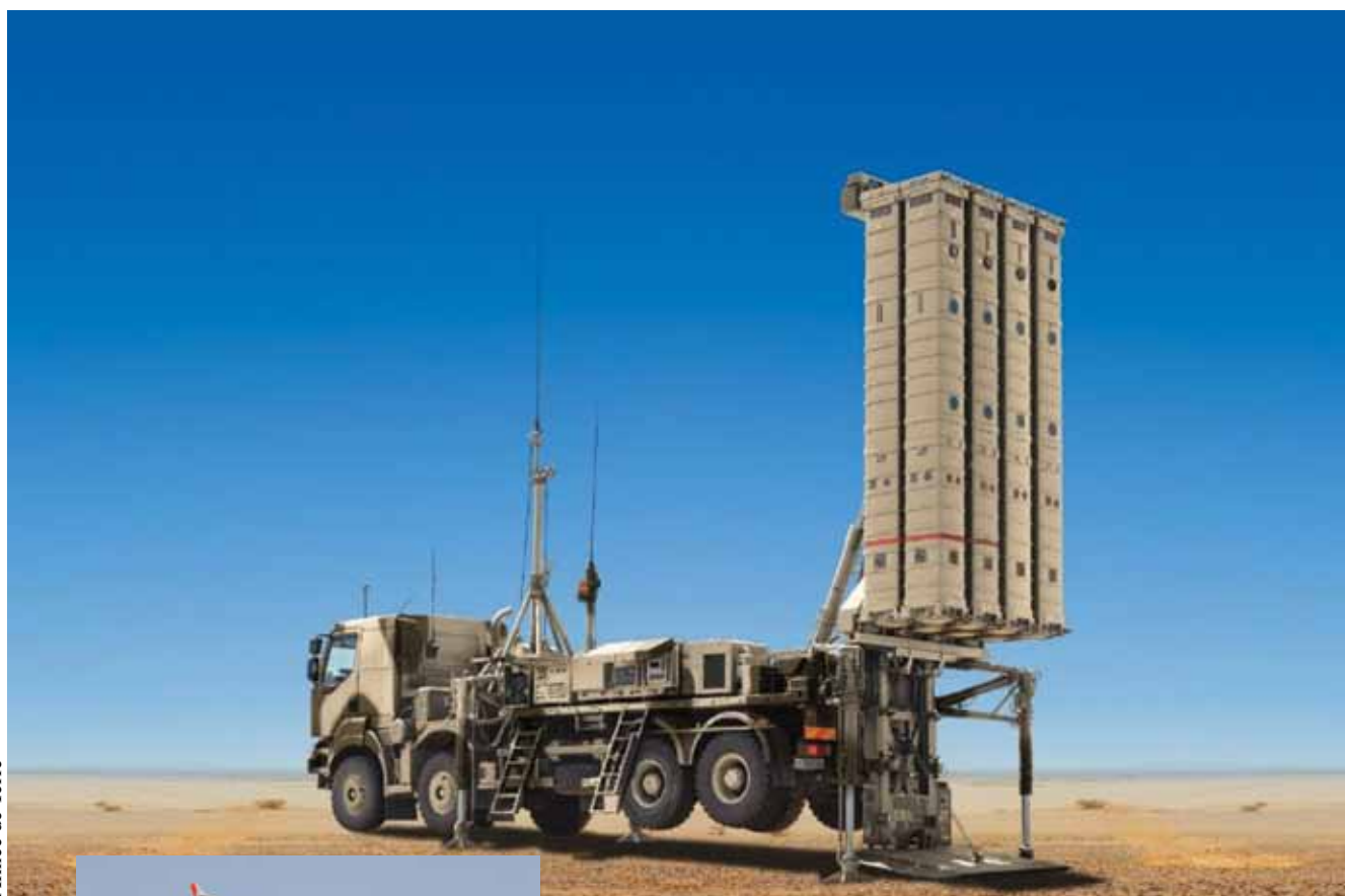
Module de missiles anti missile franco-italiens SAMP-NG