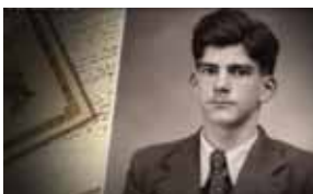
Jacques Voyer (court métrage de 10' réalisé en coopération (AASSDN - ASAF; 2022)

Ces films vont être complétés en 2026 par un 4 e consacré à Jacques Morlanne, fondateur du Service Action du SDECE/DGSE. Ce court métrage sera également disponible en ligne à partir du 15 juin 2026 sur notre site.