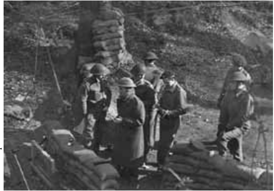
Entraînement des Sussex à la fosse à la grenade