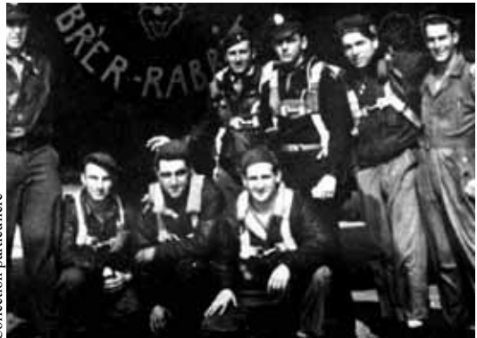
B-24 « Breer Rabbit » 8 e Air Force (escadrille Carpetbaggers)