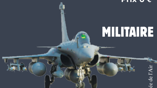
Armée de l'Air