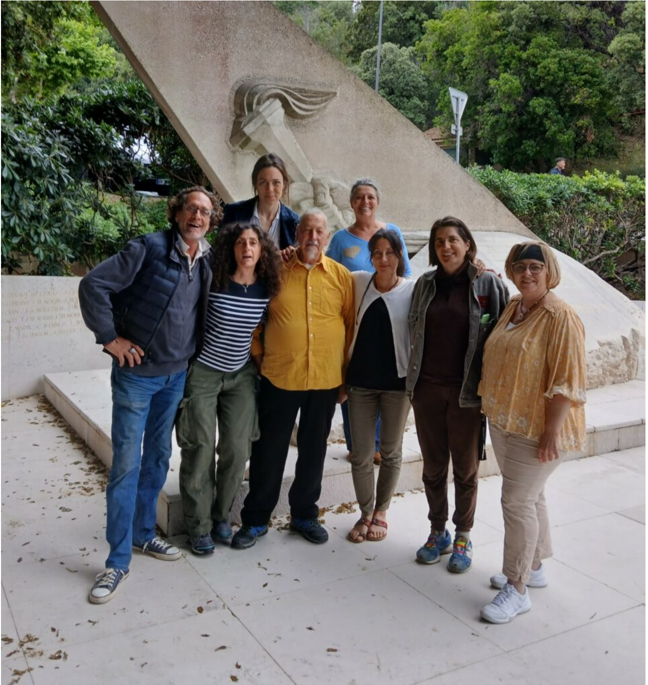
Ci-dessus : les 7 acteurs, la metteur en scène et la présidente du Cercle du littoral devant le mémorial de l'AASSDN.