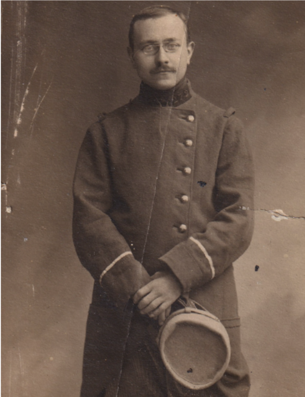
Marc Bloch, en 1914