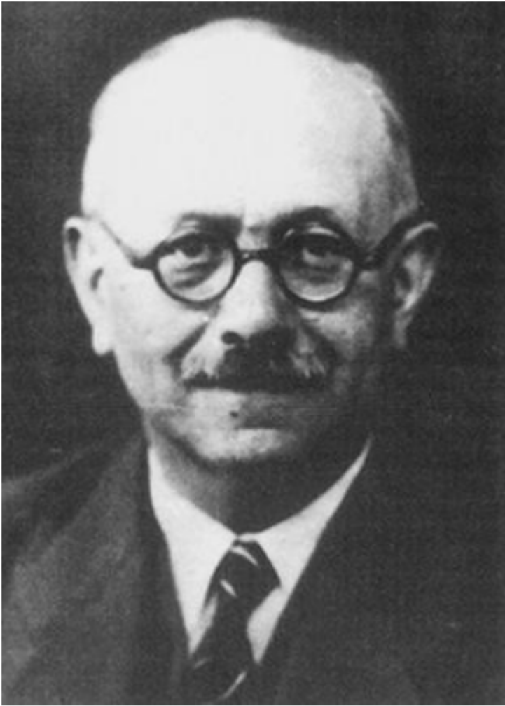
Portrait de Marc Bloch