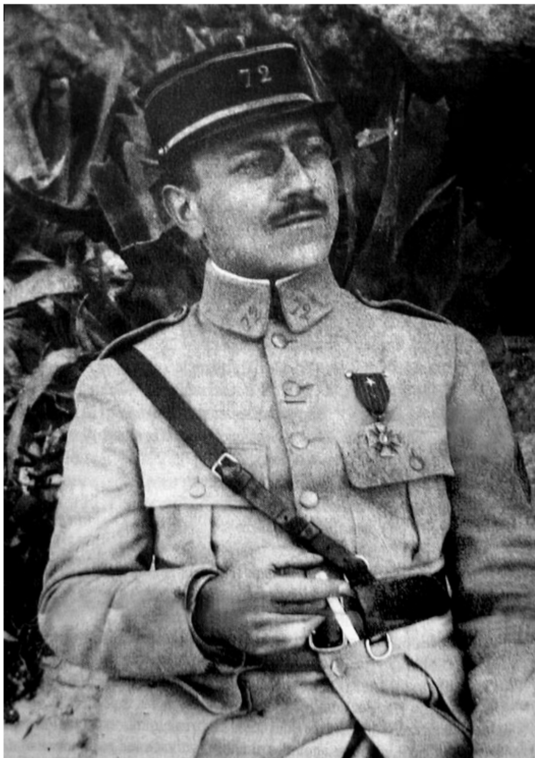
arc Bloch en uniforme du 72e RI et portant la Croix de guerre qu'il a reçue en juin 1918