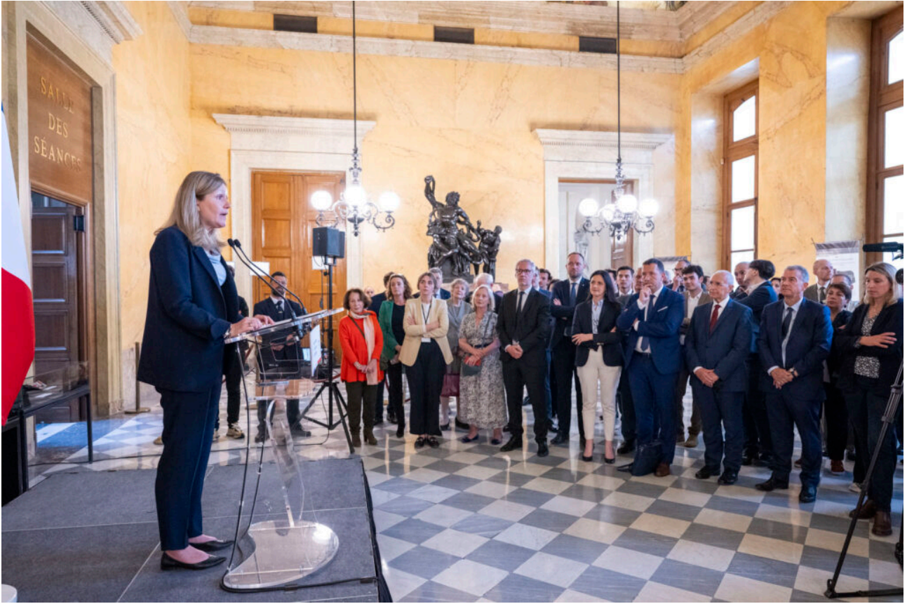
Discours de Madame Yaël Braun-Pivet