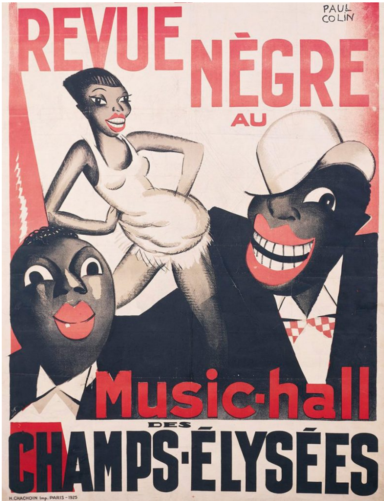
Joséphine Baker - (1948)

Les anciens des Services spéciaux sont particulièrement fiers de voir ainsi reconnue l'une des leurs mais beaucoup ignorent ce qu'elle a pu faire réellement. C'est pourquoi il a semblé utile