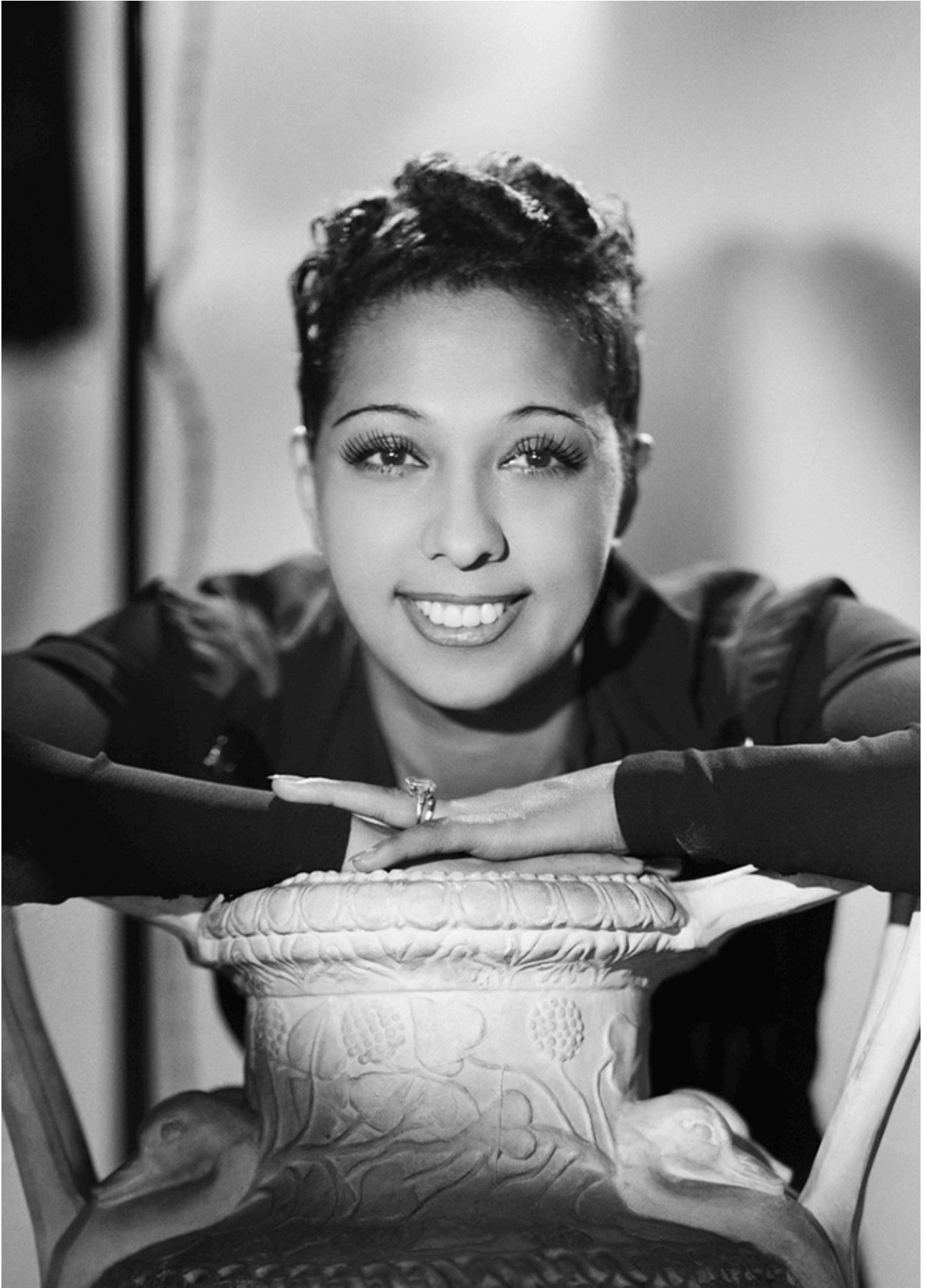
Joséphine Baker (1940)