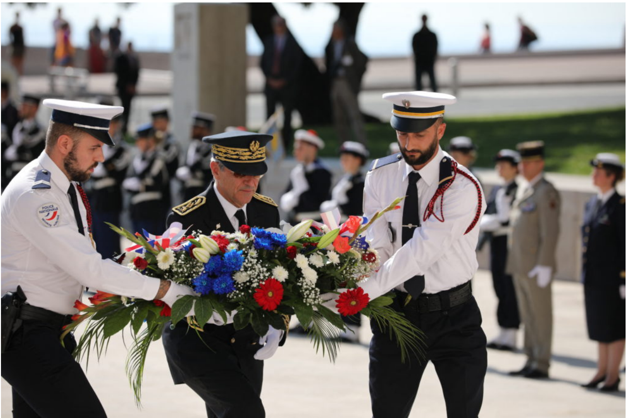
Bernard Gonzalez, préfet des Alpes-Maritimes, dépose une gerbe aux monuments aux morts de Nice

Gageons que « la victorieuse » comme le rappelle l'origine grecque de Nice, « Nikaïa », saura surmonter l'épreuve et donner l'exemple de son courage à la Nation au moment où la guerre surgit à nouveau en Europe.