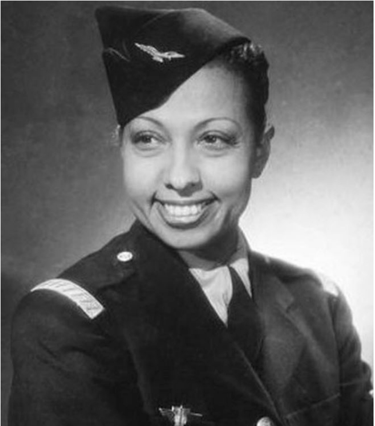
Joséphine Baker (1948)

She is today honoured not only for her action in favour of universal fraternity, as exemplified by the brotherhood resulting from the many children she adopted in the four corners of the world, but also for her true fight for the freedom of France.